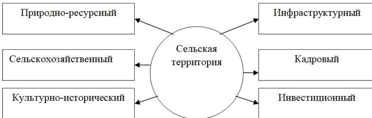
Рис. 2. Виды потенциала сельской территории

туризма на примере Самарской области, выделяет следующие факторы, сдерживающие развитие сферы: отсутствие инфраструктуры, проблемы с транспортом, низкое качество сувенирной продукции, недостаток культурно-массовых мероприятий для гостей, неразвитая экскурсионная деятельность