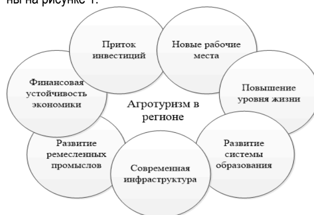
Рис. 1. Эффект от развития аграрного туризма для экономики региона

Положительные последствия развития агротуризма в регионе как фактора устойчивого развития регионов с сельскохозяйственной специализацией представлены на рисунке 1.